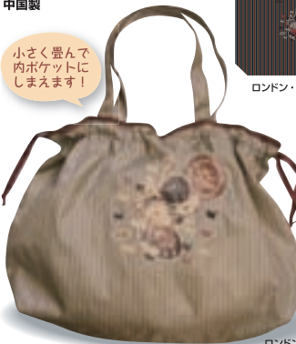
ロンドン・サンドST