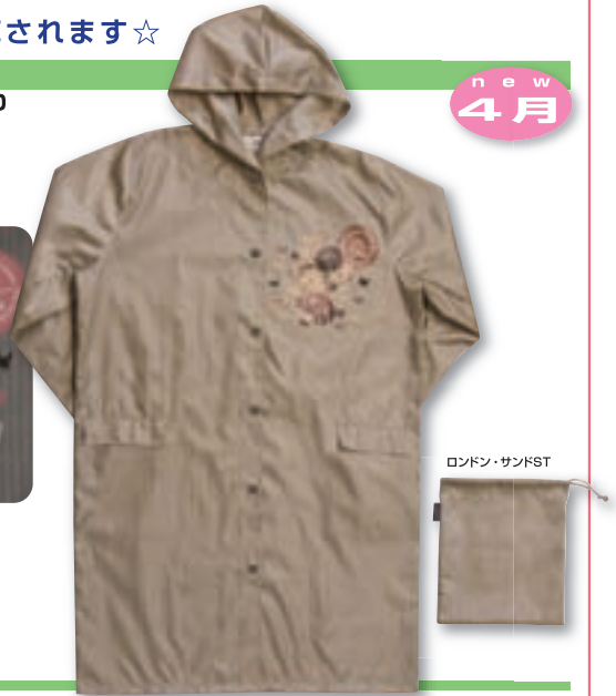
ロンドン・サンドST