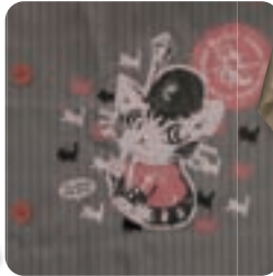
ロンドン・グレイST