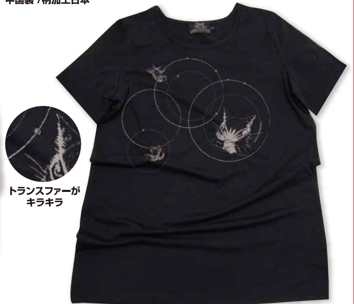
トランスファーが キラキラ

伸びるペア天竺素材です、大人っぽい丸い輪が共鳴している柄。 トランスファーがキラキラしてかわいい!SとMサイズはややフィットサイズ。 Lサイズはゆったりサイズのまま袖丈がやや長めの30cmで気になる二の腕を カバーします。