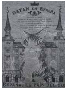
ブラック系 後ろ柄