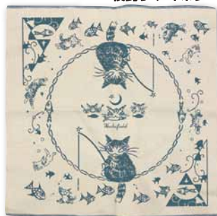
夜釣り・アイボリー

ふっくらと空気を含んでいるようなやわらかさ、吸水のよさ、毛羽立ちの少なさが 特徴です。抗菌加工済みで衛生的。傷がつきにくいので、グラスなどの食器拭きにも 適しています。こだわりの日本製です。