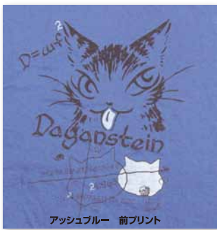
アッシュブルー 前プリント