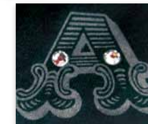
背中ロゴはトランスファーの付いた HAPPY SWING。