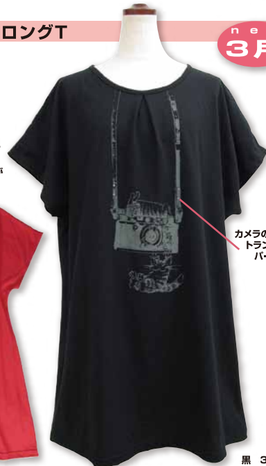
カメラのカシメにトランスファーパーツ付き。