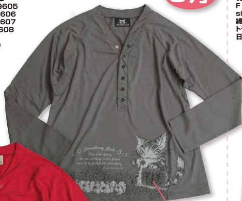
グレージュ フチポケット

税込¥7,980/本体¥7,600 M いちご摘み 深赤 929605 M いちご摘み グレージュ 929606 L いちご摘み 深赤 929607 L いちご摘み グレージュ 929608 size M 620×480 L 660×530×幅巾560 ※LサイズのみAライン 綿50% レヨン50% 他部材有り 日本製