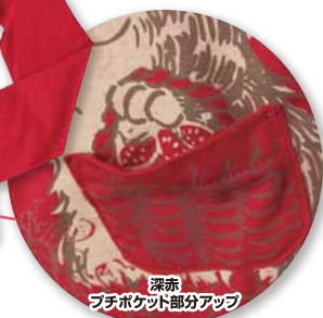
深赤 フチポケット部分アップ

リングドットと小さいポケットがアクセント! いちご摘みがかがポケットになっていて、 フチポケット♪春先にぴったりな長袖カットソー。