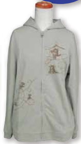
ぐるぐるダヤンが 走り回る♪