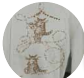
サンド 胸柄アップ