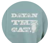
ミントグレイ 胸柄アップ