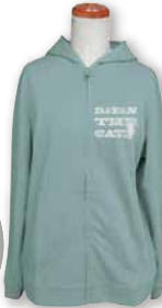
シンプルだけど きれいなロゴ♪